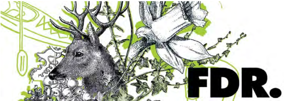
Campamento en Cazorla